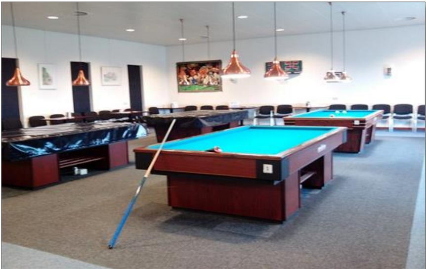
Het huidige biljarthome

Vanaf dan gaat men spelen in café "De Tolbrug". Na enkele wisselingen van uitbaters in deze locatie trekt men in 2003 samen met de KBO in bij het Dorpshuis. Hier realiseert men een eigen biljarthonk. Na de bouw van de multifunctionele accommodatie "De Zandloper" in 2009, heeft men nu een eigen Biljarthome met 4 tafels. Om organisatorisch slagvaardiger te kunnen optreden werd besloten om in 2015 te komen tot de oprichting van "Biljartvereniging Bergharen", waarin de biljarters van de "KBO" en "De Vriendenkring" hun krachten bundelen. Sinds 1976 wordt er gespeeld in de competitie van de KNBB, district Nijmegen.