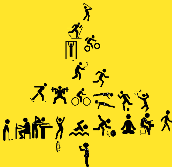
Figuur 2. Positionering sporttakken naar huishoudinkomen

Bron: Nationaal Sportonderzoek (NSO), 2018. Bewerking: Mulier Instituut.